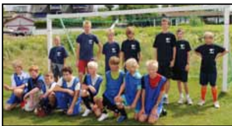
De något äldre spelade bra och jämt