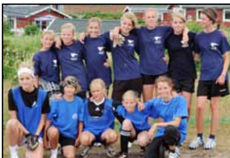
Tjejerna såg ut att ha skoj tillsammans