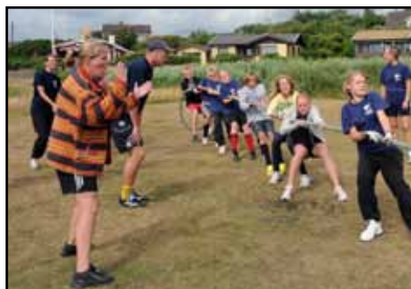
Ungdomarna drar stora lass, och var det enda lag som vann på den torra delen av planen