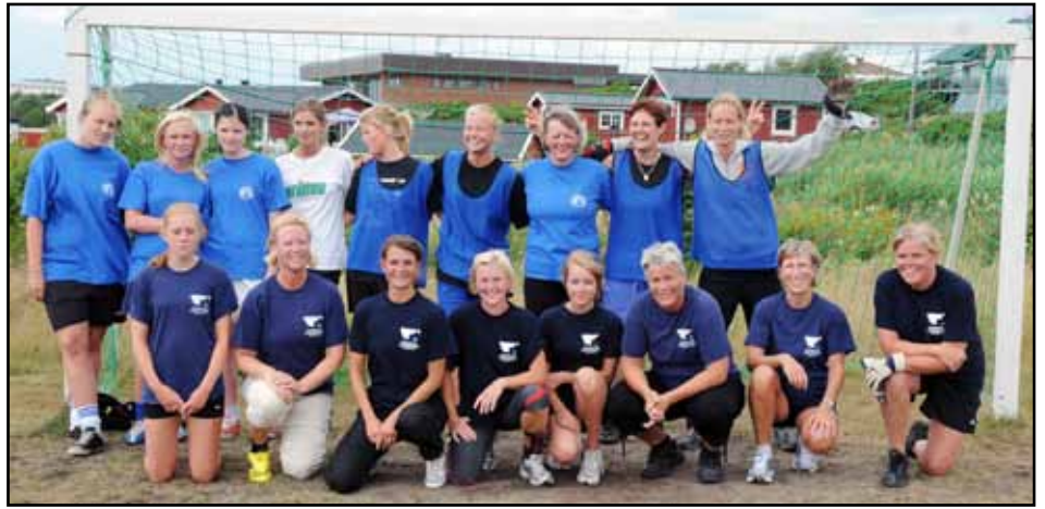
Kuggaviken har alltid duktiga damer men det är väl ändå något visst med Vassbäcksflickorna