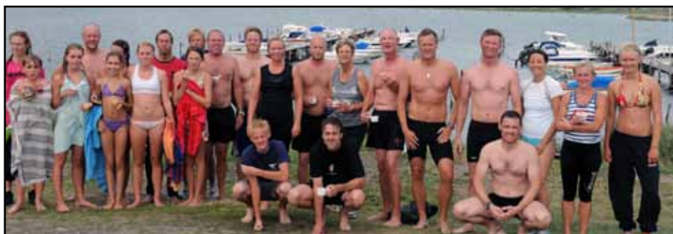
Årets triathlondeltagare. Man kan konstatera att solens strålar tar olika hårt