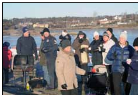
Med röda kinder och näsor dricks det glögg i kylan