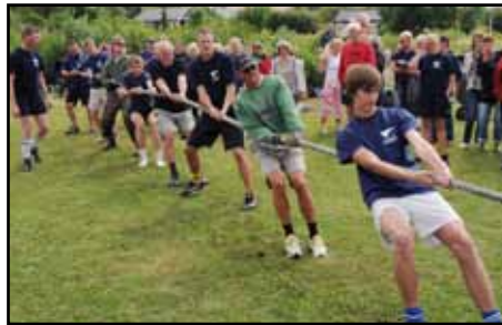
Herrlaget kämpade på rejält stöttade av fiberrik kost och publik