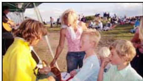
Lottakären gör som vanligt ett bra jobb