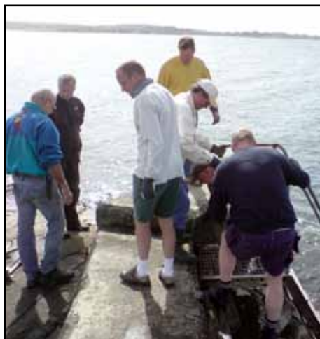
En av Vassbäcks unika föremål är vår eminenta trampoline, som kräver underhåll