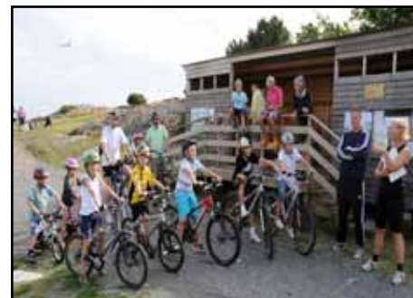
De yngre på startplats