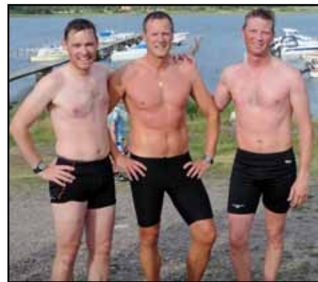
Topp 3 i herrklassen pustar ut och drar in magarna