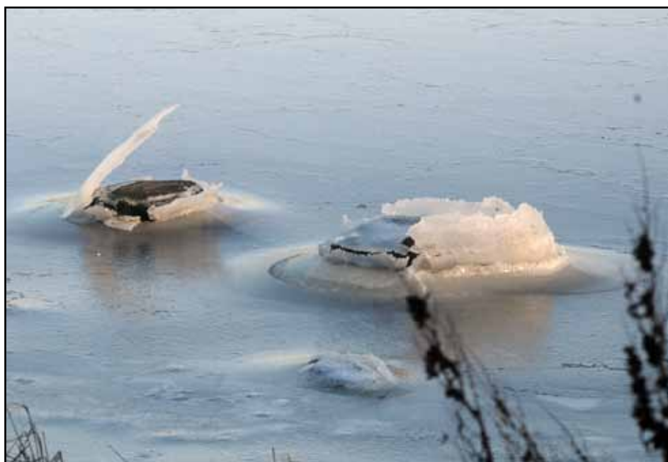
Vad gör då Vassbäcksborna nyårsafton? - Se reportage på sidan 3