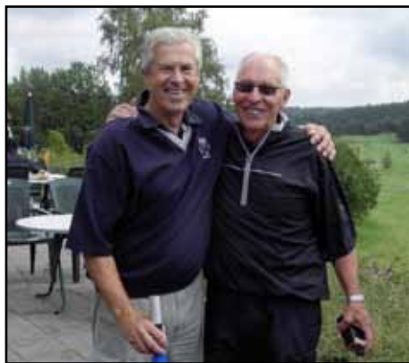
Björne och Bertil blev kompisar