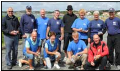
Boulelagen håller i sina kulor. Närmast lillen gäller, de verkar ha närmast kul

Men det som ändå är viktigast lyckas vi alla med, nämligen att ha trevligt tillsammans.