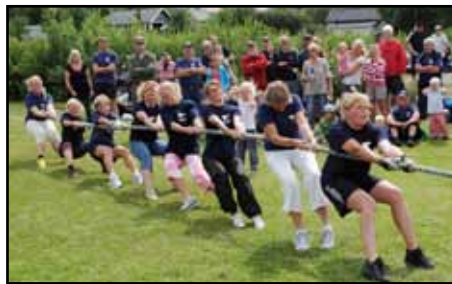
Våra flickor bjöd på dragshow