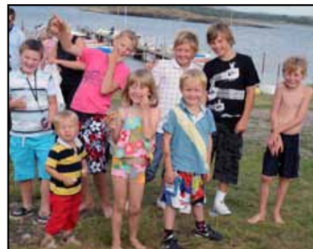
Några yngre efter målgång