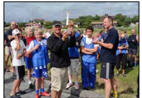
Åter vann Kuggaviken vandringspriset som de nu fått för evigt