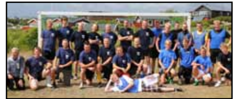
Vassbäckslag består av många och erfarna fotbollspelare. Kuggavikslaget bestod av yngre och aktiva spelare