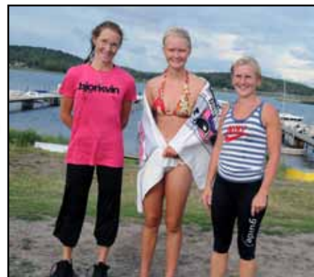
Topp 3 i damklassen

Lite ofint så tog arrangören själv kommandot i loppet och kunde segra efter många års fatala misslyckanden med punkteringar på cykel och bristningar i benmuskulatur. Man skall aldrig ge upp och passa på när tidigare segrare inte deltagit.