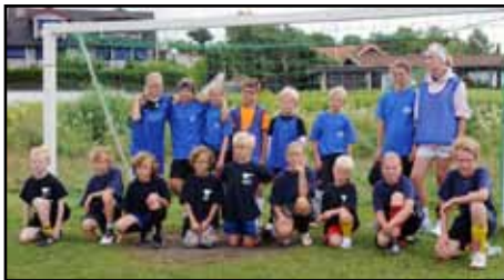
De allra yngsta fotbollslagen på bild