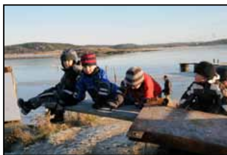
Barnen leker vid stranden oavsett årstid

Nu slog inte vargavintern till ordentligt innan nyår, men de som känner till sin historia har inte sett en så kall vinter sedan 1987.