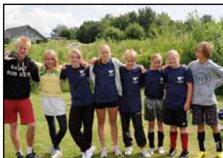
Härliga ungdomar vi har i Vassbäck