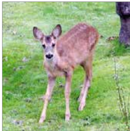
Reportage: Helena Heijdenberg

Den globala uppvärmningen och den öka- de bebyggelsen är de viktigaste faktorerna bakom förändringarna i Vassbäck men hur ska vi göra? Uppmuntra markägarna till av- skjutning av djuren och försöka återställa landskapet som det var en gång? Eller ska vi gilla läget? Det som flaxar omkring i viken nu är inte måsar i första hand, utan färgglada kiteseglare, och det är väl inte så dumt, det heller!