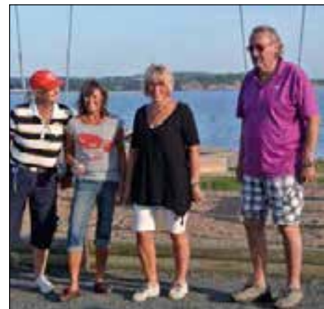
Unga och gamla samlas på boulevanen.