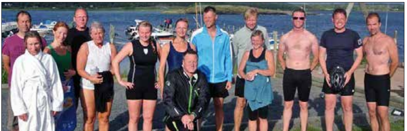
Vassbäcks atleter samlade på bild, övriga Vassbäcks atleter hade förhinder eller var publik.