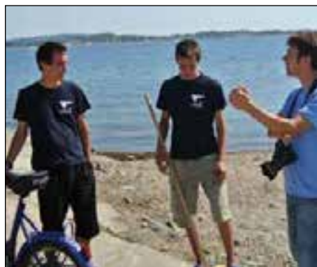
Kungsbackaposten gjorde också ett stort reportage om Vassbäck där våra strandvärdar intervjuades.