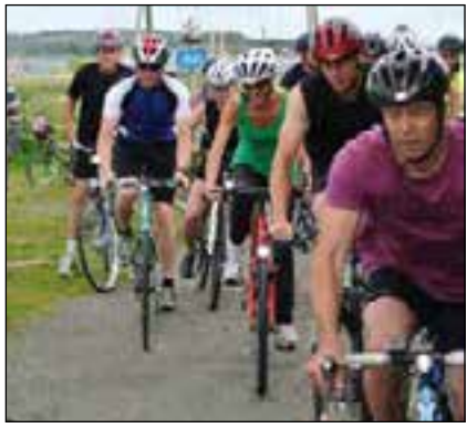
Starten är intensiv och fältet samlat.