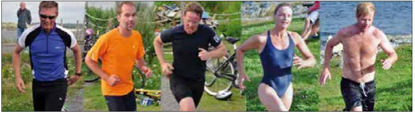
Löpstilarna är många men det syns att de tar ut stegen.