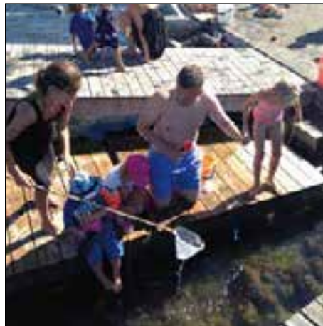
Sommardagar på bryggan lockar många till bad och krabbfiske.