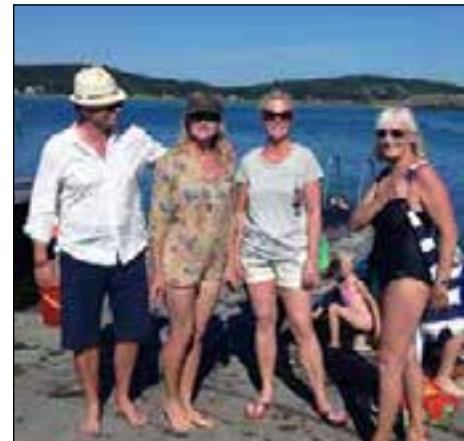
Badliv på bryggan i Vassbäck.