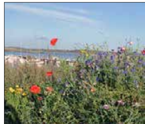
Den blomstertid nu kommer.