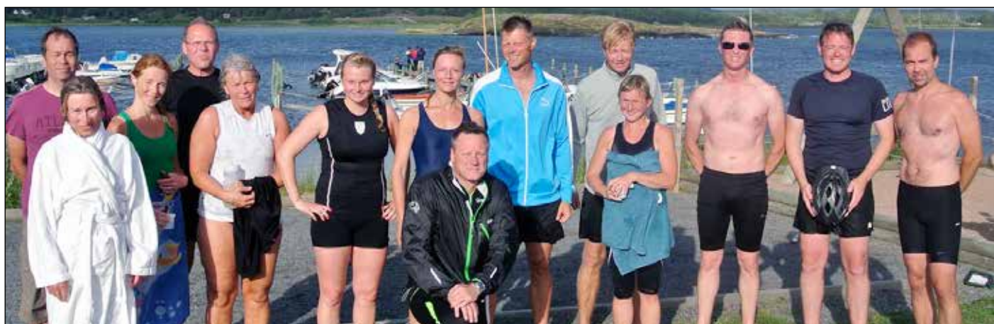
Vassbäcks atleter samlade på bild, övriga Vassbäcks atleter hade förhinder eller var publik.