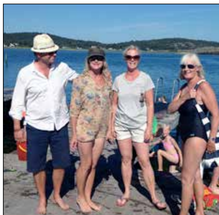
Badliv på bryggan i Vassbäck.