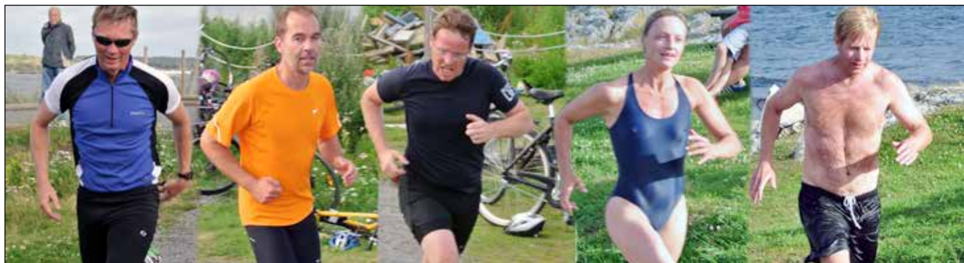
Löpstilarna är många men det syns att de tar ut stegen.