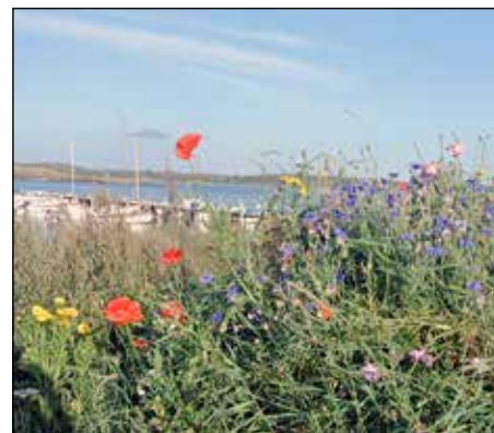
Den blomstertid nu kommer.