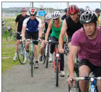
Starten är intensiv och fältet samlat.