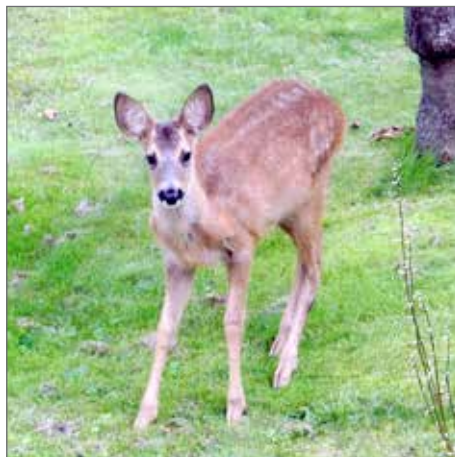
Reportage: Helena Heijdenberg

Den globala uppvärmningen och den ökade bebyggelsen är de viktigaste faktorerna bakom förändringarna i Vassbäck men hur ska vi göra? Uppmuntra markägarna till avskjutning av djuren och försöka återställa landskapet som det var en gång? Eller ska vi gilla läget? Det som flaxar omkring i viken nu är inte måsar i första hand, utan färgglada kiteseglare, och det är väl inte så dumt, det heller!