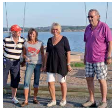
Unga och gamla samlas på boulebanan.