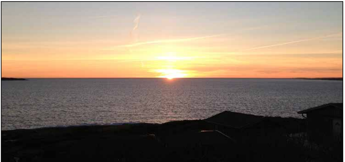
Vassbäck, vår plats på jorden. Även solen drar sig för att gå ner i horisonten.