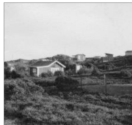
Fotot tagit upp mot Vassbäck Öfvre