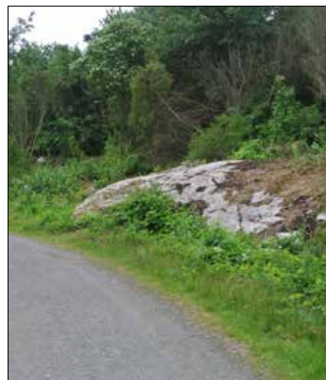
Så här fint blev det några månader senare, vid midsommartid.