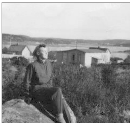
Utsikt från Strids hus 1953, på Åsa Höjdväg