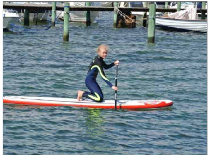
Tuva åker på en sup - stand up paddleboat.