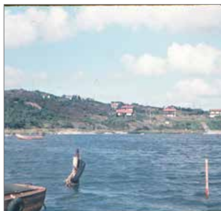
Åter en hamnbild från sent 1950-tal