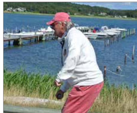
Calle har rätta greppet just innan kast.