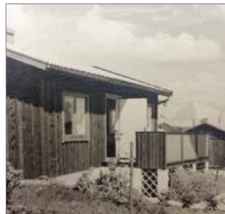
Familjen Janlinds hus 1950-tal