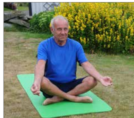
Yogan ger inlevelse hos deltagarna.