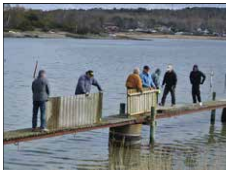
Brygg 2 kunde lägga ut sina bryggdelar

Det stora projektet för året jämte att som vanligt lägga i bryggor, stegar, ta fram soffor, bord och snygga till rent allmänt på badplatsen var många engagerade i att gallra, röja och såga ner i skogen fram till badplatsen.