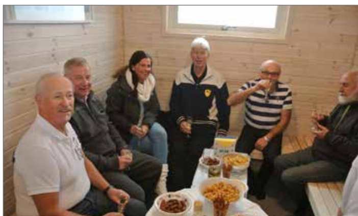
I nya mingelhörnan samlades läckra bastubadare runt andra läckerheter.