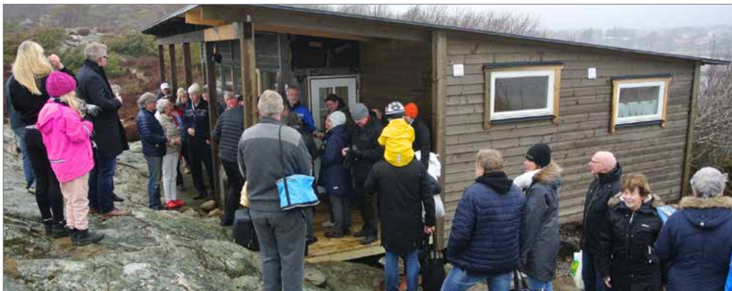
Invigningen av bastuns nybyggnad var välbesökt och många många var mäktat imponerade.