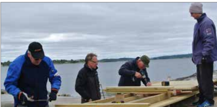
Ett glatt arbetslag snickrade ihop de nya bryggdelarna.