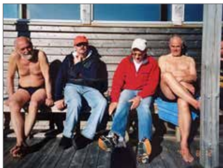
Grabbsnack under och efter bastun.

Ett av många smultronställen är att kunna sitta och prata vid bastun, det brukar bli härliga samtal och man behöver inte basta heller för den delen.