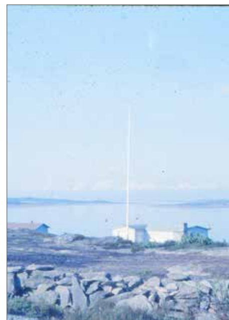
Bild från Vassbäck Öfvre mot havet 1950-tal