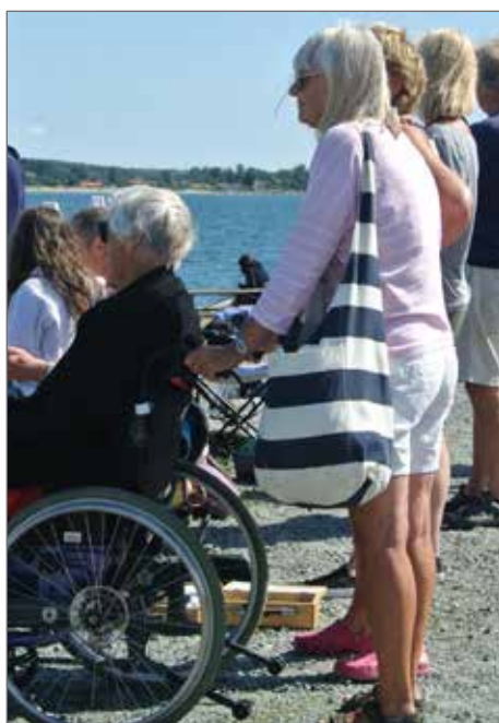
Boulen lockar publik till banan.