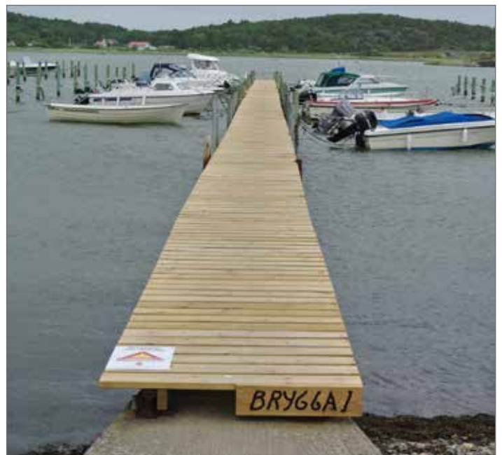
Tada- så var det lagat och så fint det blev. Slutet gott...