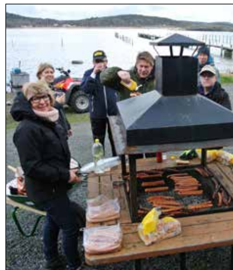
Som brukligt är erbjuds det fiberrik förtäring efter välgjort arbete.