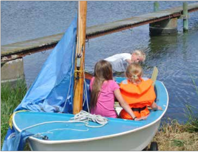
Segelbåten riggas på land.

för detta evenemang, men de som var där trivdes.