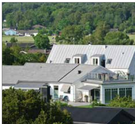
Huset på Näsbergstigen