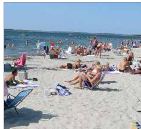
Stranden i Stråvalla.

Stranden i Stråvalla är en mycket omtyckt och populär strand som det enkelt kan cyklas till eller åka bil för den delen. Där ser man Vassbäck söderifrån.