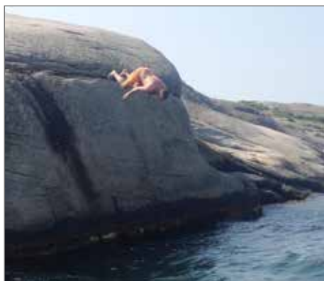
Dykklippan vid Norstön.

Nordsidan av Nordsten, eller Norstön, som den också egentligen heter har klippor härliga att bada ifrån. Speciellt en dykklippa där det är ca 4 meter ner, där har jag dykt många gånger, men det blir besvärligare för vart år att ta sig upp igen.