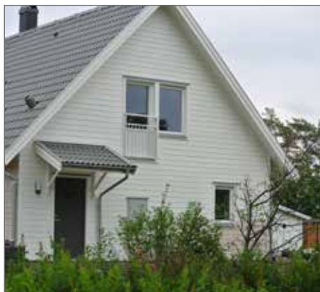
Huset på Nortorpsvägen

presentera hur några av dessa hus nu ser ut.