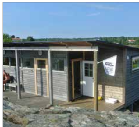
Bastun är ju också ombyggd