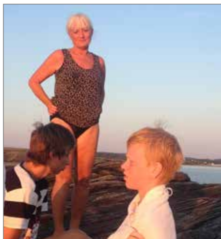
Klipporna vid Vassbäck.

För ungdomar lockar kanske Åsa Havsbad med sin fina strand och restaurang.