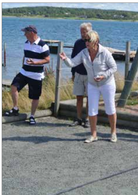
Affa vet hur man gör med kloten.