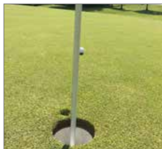
Lokets specialpris vanns för detta nedslagsmärke på hål 17.