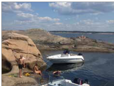
Kungsbackafjorden, Inre Lön.

Vi har hittat ett ställe i Kungsbackafjorden, Inre Lön, där det ser ut som en lagun, där man kan sola, dyka från klippor och kanske bara göra en upptäcksfärd.