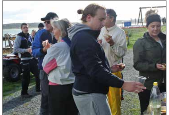
Som brukligt bjuds det på förfriskningar.