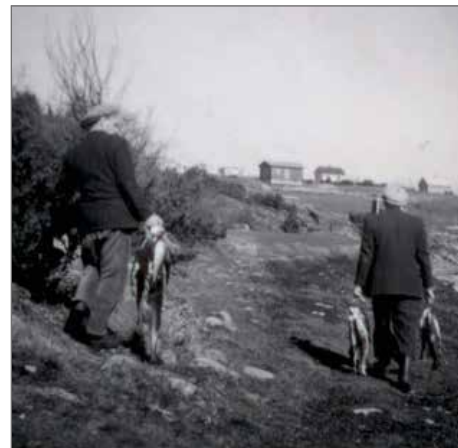
Fiskfångst på väg till grytorna.