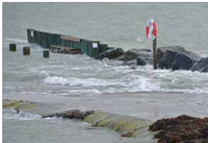
Det känns bra att vi förstärkt våra bryggor de senaste åren.