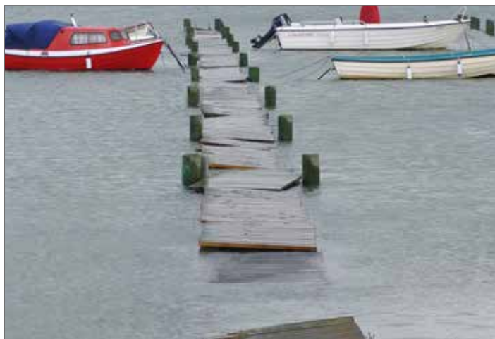
Knud var inte nådig mot våra bryggor som blev flytande.