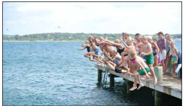
En flock i rörelse, med bad i sikte. Försten i.