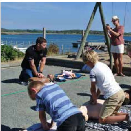
Viktigt att även unga utbildas.