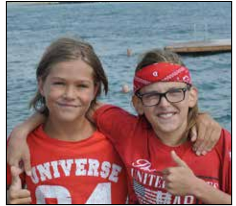
Rött var dessa ungdomars färg.