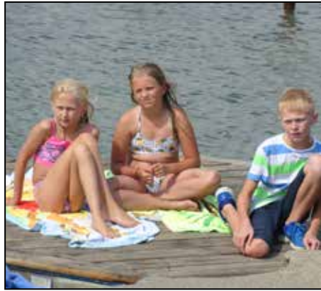
Barn på flotten efter simturen.