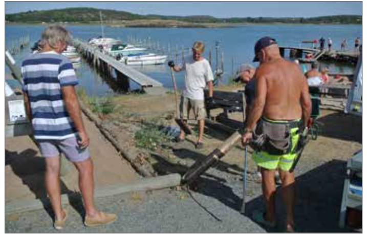
Det är gott virke i våra gubbar, bättre än det de tar bort.