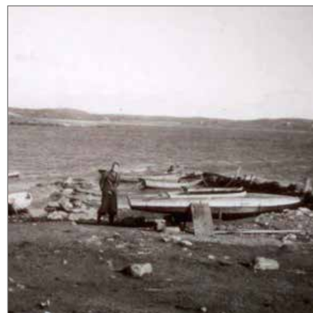
Båthamnen har utvecklats.