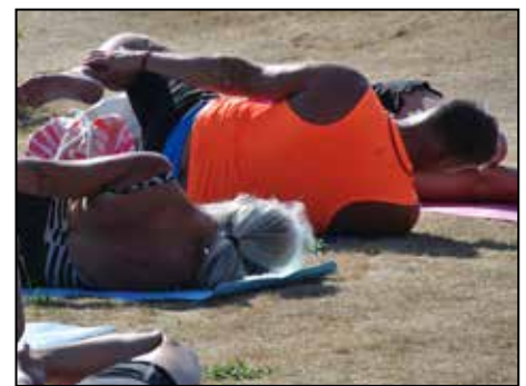
Det finns som sagt smidiga och så finns det stela deltagare, alla får vara med.