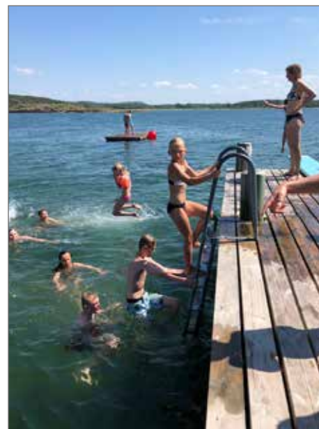
Badande barn i Vassbäck.