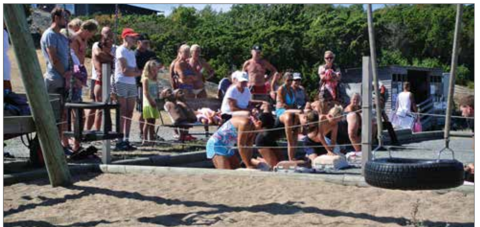
En stor uppslutning var det på aktiviteten som hölls på boulebanan.