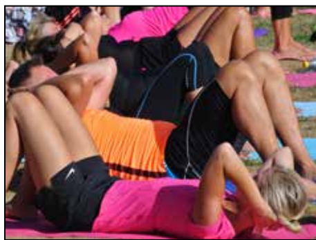
Knäna böj och armarna bak, dra in magen och andas.