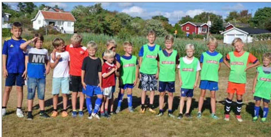
De unga fotbollspelarna samlade på bild, en mycket uppskattad aktivitet i gemytlig anda där alla som vill får spela.