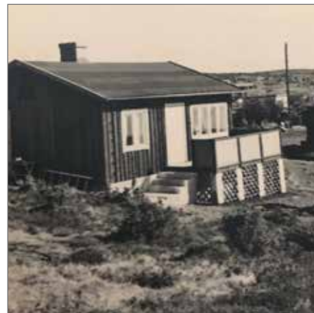
Janlinds hus från år 1952.