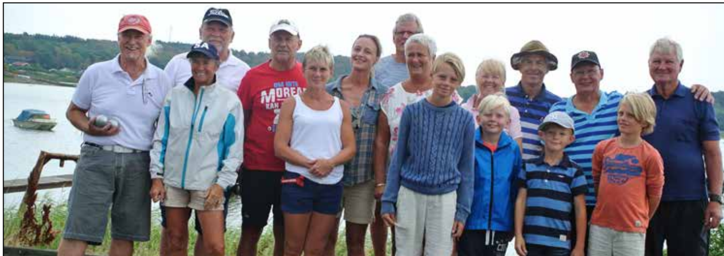
Gruppbild innan tävligen startar, alla har fortfarande kvar en önskan om att få pokalen.

Det är tradition att Vassbäcks boulemästerskap skall spelas i solsken. Tävligen är en partävling och lagen lottas på plats.