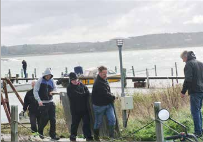
Brygga 2 sluter upp mangrant och är lika som bär.

Lika kul som det är att ta fram alla bryggor och bänkar inför badsäsongen, lika viktigt är det att ta in dem igen innan höststormarna drar in.