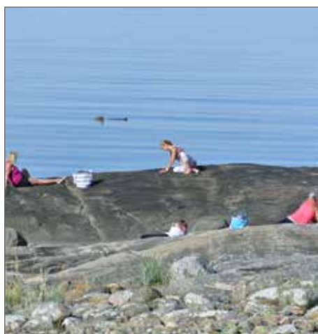
Människor i yogaposer i naturen visas på bilden.