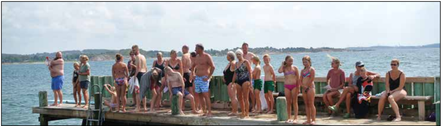
Bilden kunde varit tagen vilken baddag som helst. Vår badbrygga lockar många badande.