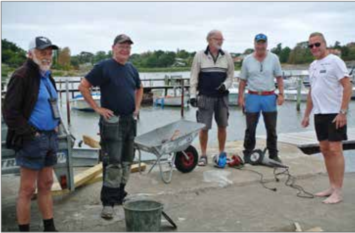
Delar av arbetslaget uppställda för foto, sen blev det fart.