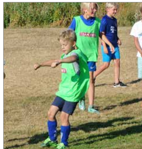
Fotboll är glädje och ger kamrater.