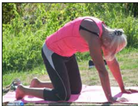
Katten reser rygg på bilden, som katten på Tudorbatteriet.